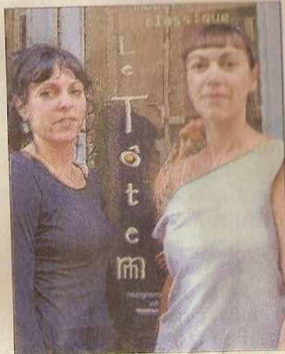
Journée portes ouvertes pour l'association Tôtemm créée par deux sœurs passionnées de danse.

École de danse Tôtemm, rue du Plan. À partir de 4 ans. Renseignements au